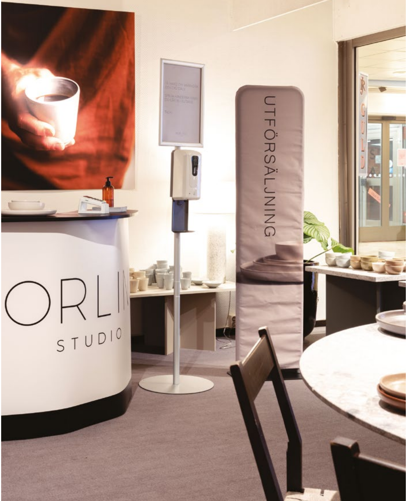
Retail Stand, Counter Case XL, Handspritstation.